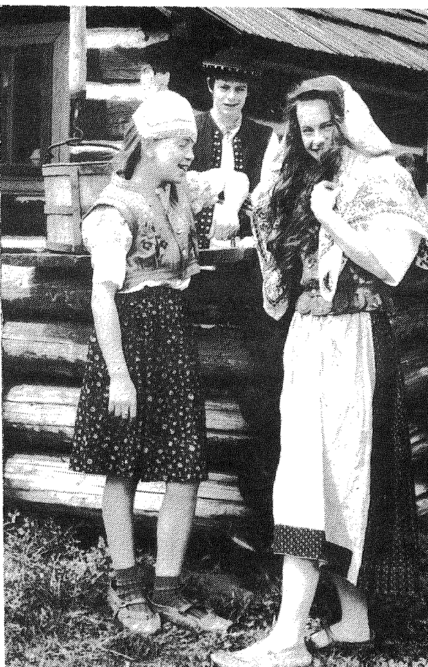
Лемковска молодеж звиджат Музей ЛК в Зиндранові. - 1993 р.

Музейне конто: Bank Spółdzielczy w Dukli - Nr 680-2711-1 з дописком "Na Muzeum w Zyndranowej".