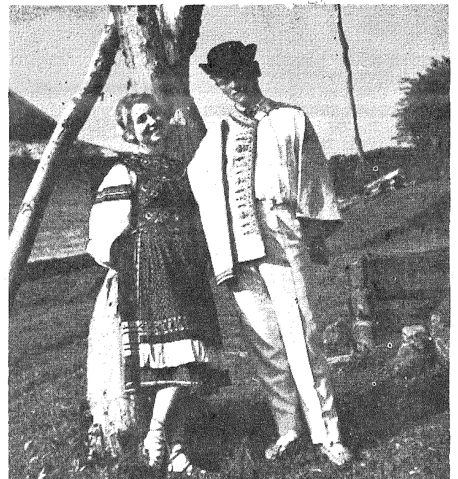
Лемковскы типы — залюблены.

За сто тридцят літ, якы ділят нас от часу, коли Нил Попов писал о Лемках, барз ся змінило. Дві світовы війны і виселіня зробили свое. Але, незважаючи на стараня ворогів, на руйнуючу силу часу і барз трудны умовы, ми жыеме і одроджаме релігійне і народне жытя в р,щдних горах. І нех тепле і правдиве слово о нас славянского брата Н.Попова допоможе нам вистояти і отчути гордост за ниших предків, за наше коріня в священній землі - Лемківщині.