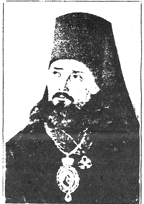
ПРЕОСВЯЩЕННЫЙ ИННОКЕНТІЙ (Вениаминовъ), Первый активный Владыка Аляскинскій.

Промышленники «Русско-Американской торговой компаніи», основавшие поселеніе «РОСС», были первыми насчителями вѣтры православной въ теперешнемъ штатѣ Калифорніа. Они сами же были и алеуты, котрыхъ они привезли сюда съ острова Ситхи и тутъ поселили. Въ крѣпости своей они сразу же, какъ только утвердились тутъ, построили часовню и по воскреснымъ и праздничнымъ днямъ собирались для молитвы. Священника у нихъ сначала не было, но черезъ нѣкоторое время, когда укрѣпилась и увеличилась русская миссія въ Америкѣ, въ Фортъ Россъ, для совершения богослуженія начали пріѣзжать время отъ времени священники съ Аляски.