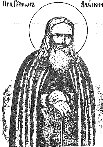
ПРЕПОДОБНЫЙ ГЕРМАНЪ АЛЯКИНСКІЙ, миссіонерствовавшій на Аляскѣ 43 года.

По распоряженію главнаго начальника Баранова, съ 1809 г., не разъ отправлялись экспедиціи на югъ Америки, къ берегамъ Новаго Альбіона (сѣверная часть нынѣшняго штата Калифорнія), не принадлежавшаго тогда ни одному государству. Одной изъ тѣхъ экспедицій, въ 1812 г., подъ командованиемъ Кускова, посчастливилось утвердиться и основать, недалеко отъ г. С.-Франциско, поселеніе «РОСС», т. е. русское. Въ поселеніи устроена была крѣпость и въ ней часовня. Около крѣпости размѣстились жилища, привезенныхъ сюда съ Аляски русскихъ и уже образовавшихся алеутовъ. Мало-помалу образовались алеутскія цѣлыя торговля компаніи. Главной была «Русско-Американская торговля компанія», которая получила разныя права отъ русскаго правительства на веденіе своего дѣла, получили отъ него и защиту отъ враговъ. Правительство не только устранило въ колоніяхъ крѣпости, но посылало туда войско и военные корабли, заключало съ сосѣдними государствами договоры. Также договоры-компенсіи заключены были Россіей, на примѣръ, съ США въ 1824 году, съ Англіей въ 1826 г. Тѣми договорами точно определялись, во-первыхъ, границы меж-