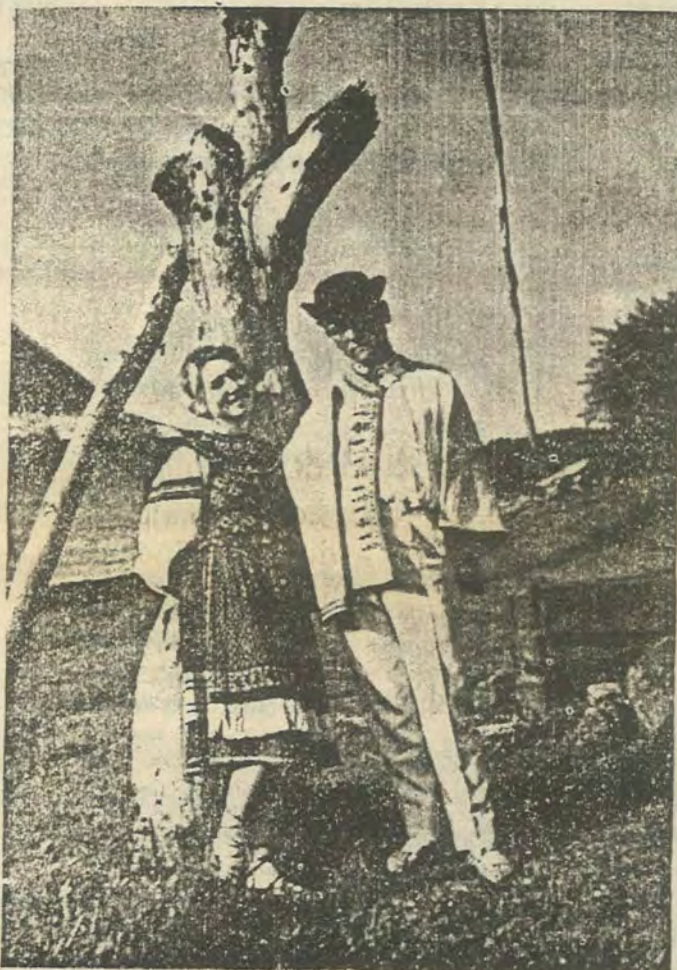
Лемковскы типы — залюблены.