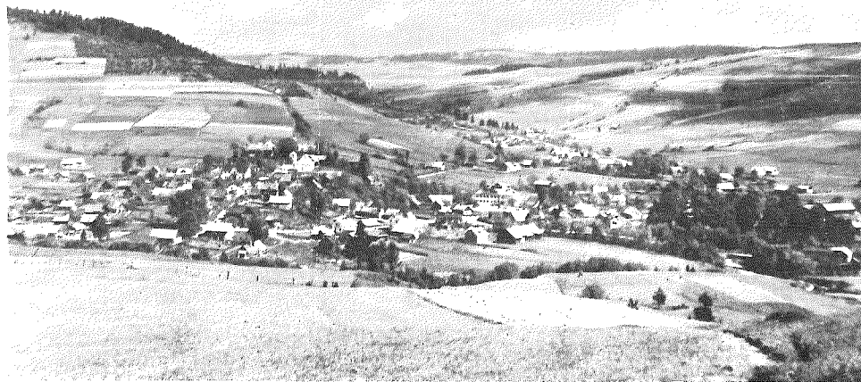
Вид на ТЫЛИЧ