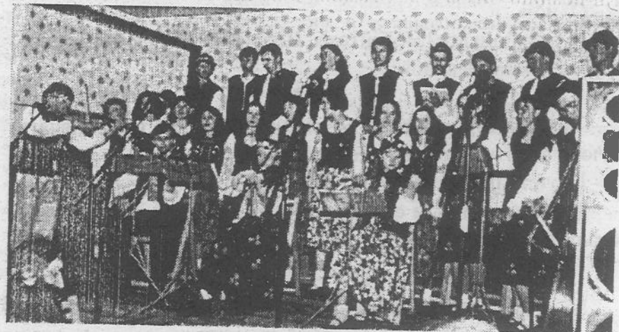
Лемковина на святі в Зиндранові

Лемковина з Білянкы своїм істніньом в Польщы не лем одновила жытя Лемків але тото жытя оздоровила, а при тым што ест найважніше – одновила, выгягла з попелу нашу лемківску культуру а мож сьмію повісти же і історію.