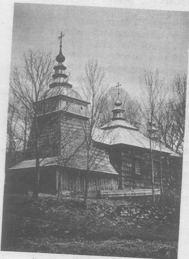
Церковь в селѣ Бортне, б. 1842 р.