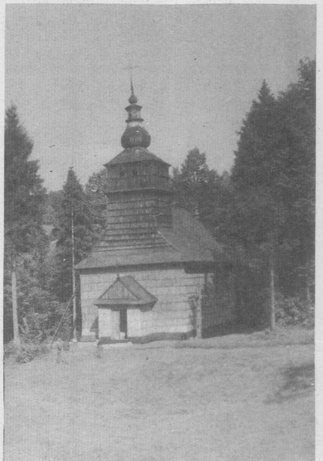
Церков в Шындарку (Горличчина) прысюлок "Долины"