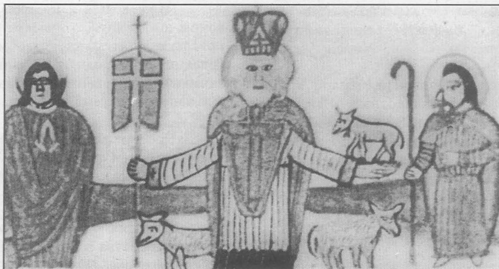
ПАСТЫРЬ ДОБРЫЙ. Акварель Никифора.